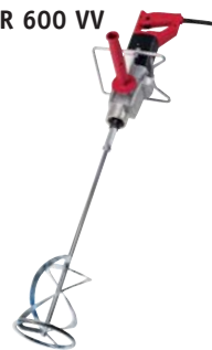
R 600 VV