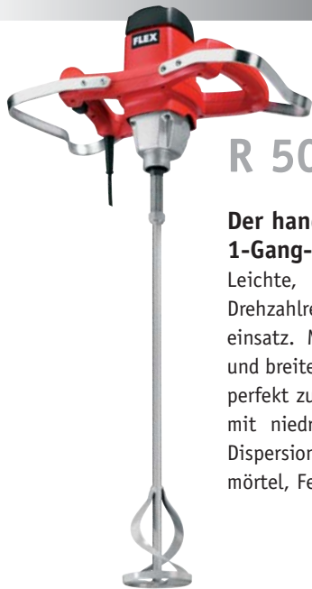
R 500 FR