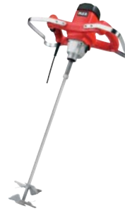
R 502 FR