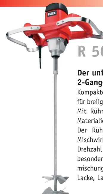
R 502 FR