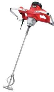
R 500 FR